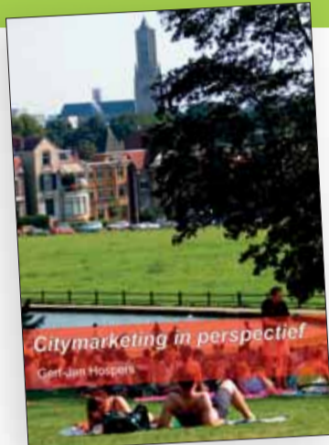
De cover van de nieuwe IVIO-uitgave 'Citymarketing in perspectief'

Een uitgave van de IVIO Advies Groep & IVIO Onderwijs Groep