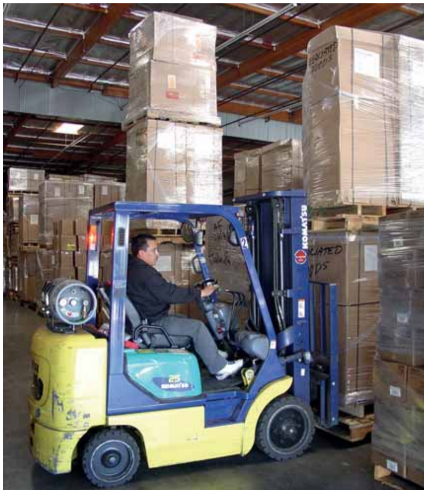
Magazijnwerk en de heftruck bedienen zijn maatwerktrainingen die IVIO-Opleiding aanbiedt

Management Trainee Programma aan voor het MKB (zie verderop op deze pagina). Maatwerk als standaard dus!