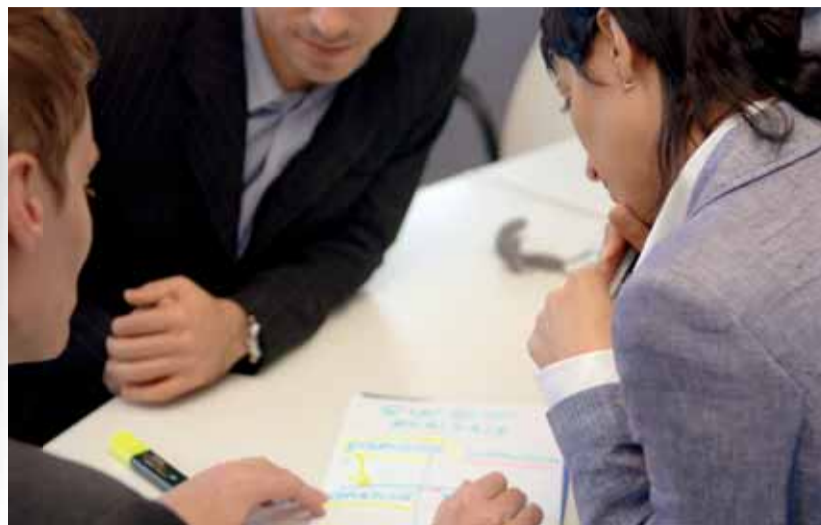
Door EVC wordt de overstap naar een andere baan vergemakkelijkt

Ontslagen worden is een ingrijpende gebeurtenis. Het heeft veel invloed op het zelfvertrouwen. En dat in een tijd dat medewerkers zich stevig moeten presenteren op de arbeidsmarkt.