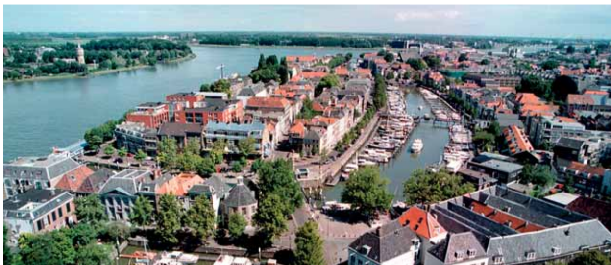
Dordrecht behoort tot Drechtsteden waar IVIO-Integratie actief is

Sinds 1 juni 2009 voert IVIO-Integratie voor de Sociale Dienst Drechtsteden* het voortraject voor de Wet Inburgering uit. Dit voortraject bereidt de analfabete en toekomstige inburgeringskandidaten via modules-op-maat beter voor op de inburgeringscursus. Zo kunnen de slagingskansen van cursusdeelnemers en hun integratiekansen in de samenleving sterk worden verhoogd.