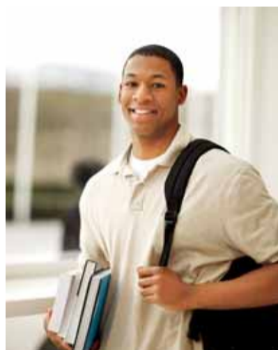
De Wereldschool biedt nu ook stof aan voor vmbo

De Wereldschool biedt vanaf nu ook havo en vwo 4 aan. Het is mogelijk om via de Wereldschool de profielen natuur en techniek, natuur en gezondheid en economie en maatschappij te volgen. Vanaf komende schooljaren is het ook mogelijk om havo 5 en vwo 5 en 6 te volgen via de Wereldschool. Leerlingen